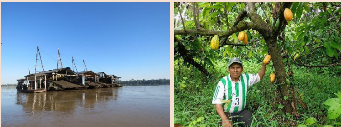
Figura 4.1 Dragas y productores

Se tienen pruebas contundentes de una severa intoxicación de la población Amazónica, incluso existen indicios de elevadas tasas de discapacidad mental en áreas mineras, pero los gobernantes bolivianos siguen fallando en la aplicación efectiva de los acuerdos internacionales como el convenio de Minamata y la Convención sobre la Diversidad Biológica, y siguen manejando falsos discursos, mientras que la realidad muestra un Estado fallido, en cuanto a sus sistemas de participación social y fiscalización e incluso una desestructuración intencional de las instituciones ambientales.