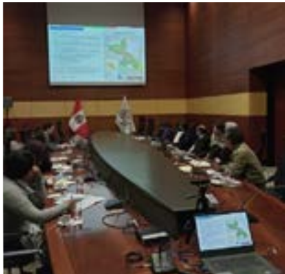
Cancillería del Perú

La OTCA también propició una reunión híbrida entre las cancillerías del Perú y de Bolivia, donde las contribuciones se enfocaron en la importancia de las prácticas de la medicina indígena y en el fortalecimiento de los servicios de salud del primer nivel.