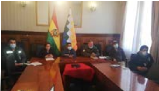
Cancillería de Bolivia